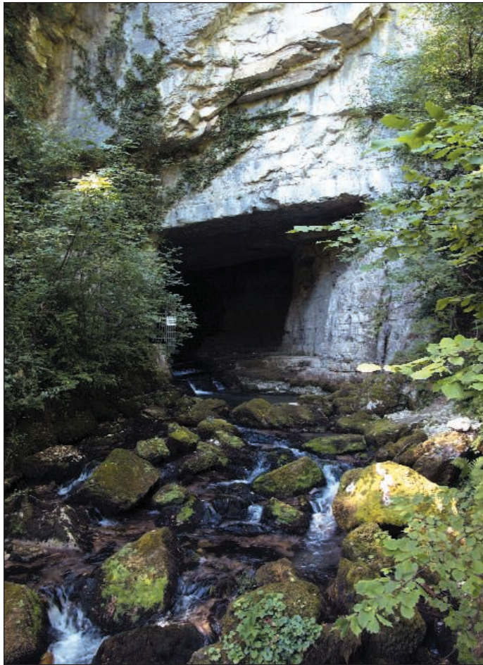
Cuves de Sassenage. Surgencia del río subterráneo de la Gouffre Berger.

oficial de la expedición, aunque según la prensa de la época también lo consiguió Vicente Sicilia.