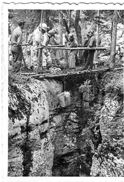
Gouffre Berger 1956

Alpin Français (SGCAF), descubridores de la misma y organizadores de aquella expedición internacional histórica en la que participaron cuatro miembros del Grupo Espeleológico Edelweiss. Hace 10 años, con motivo del 50 aniversario de la expedición, ya dedicamos un extenso artículo a la misma, por lo que ahora procuraremos hacer una breve reseña, pudiendo ampliar detalles en el artículo original (Martín, 2015).