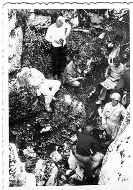
Gouffre Berger 1956