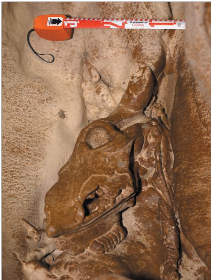
Cráneo de bóvido de la Galería Txocolatúa. OG.