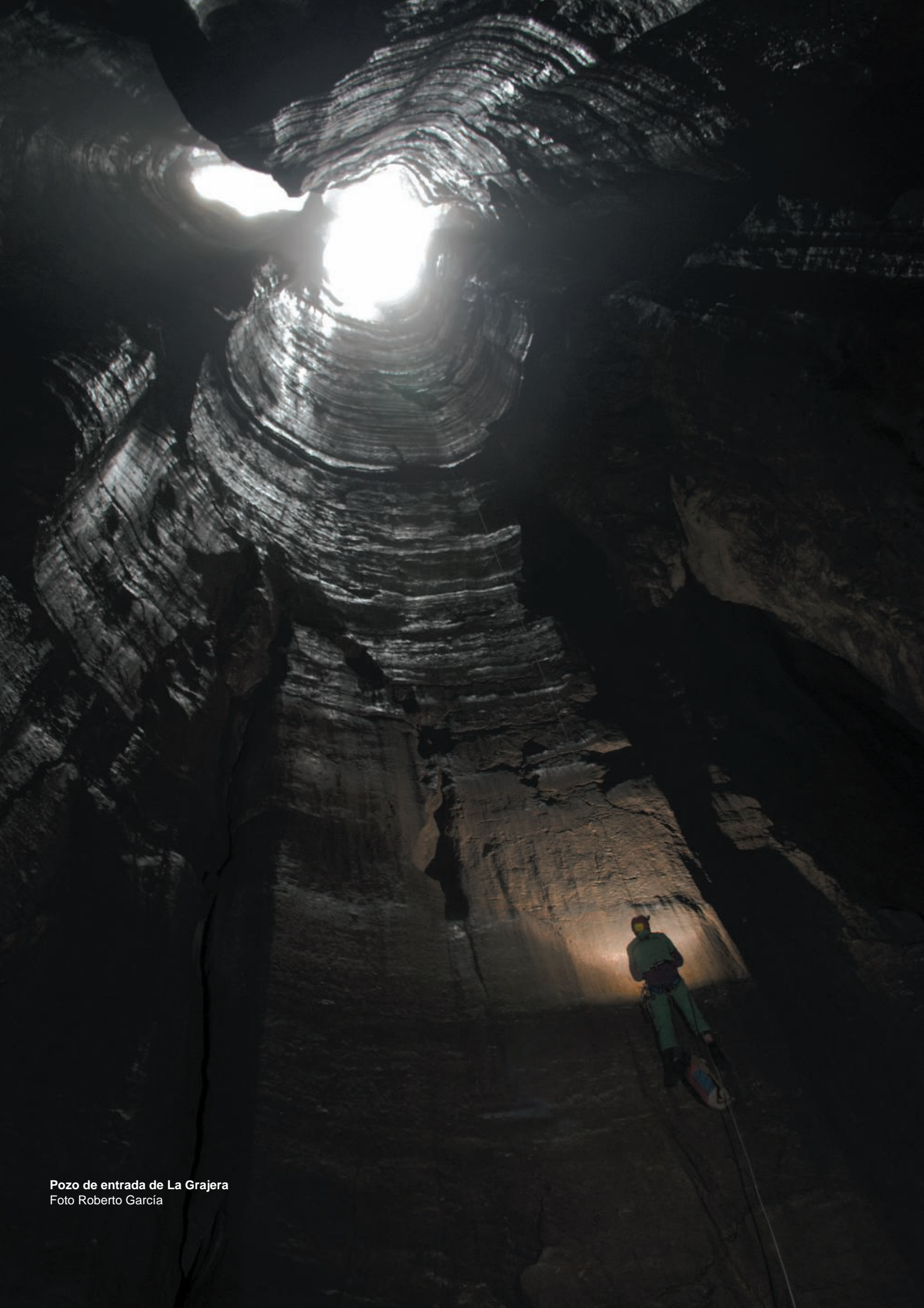
Pozo de entrada de La Grajera