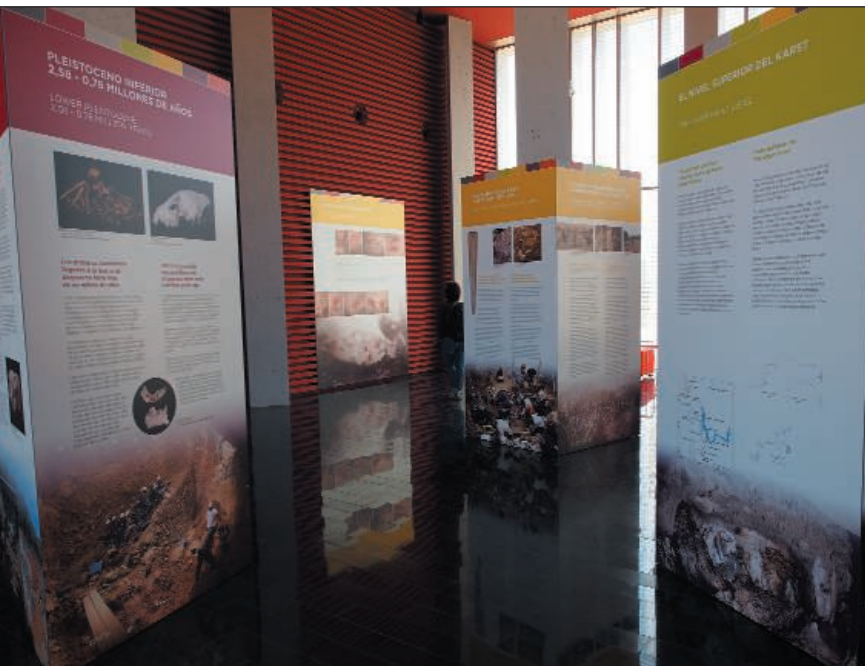
Exposición en CAYAC de Ibeas de Juarros