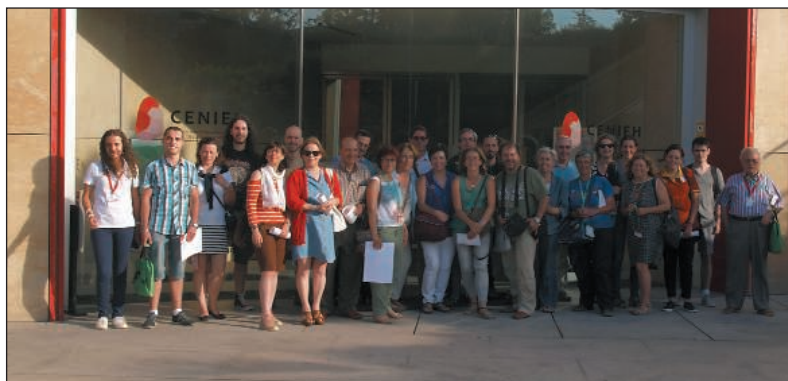
Rectora del Monumento Natural.