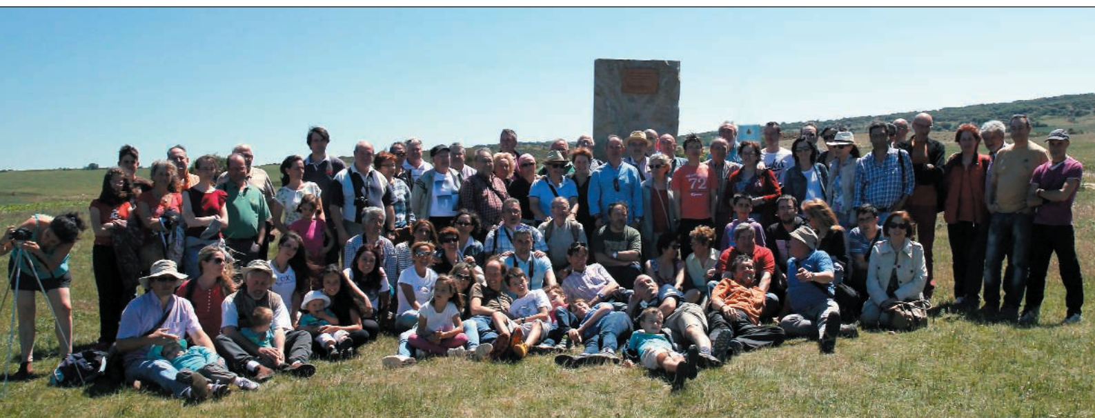
Participantes en Jornada de Encuentro 2015 en menhir conmemorativo al GEE

interior de la cavidad y varias más a los exteriores para mejorar algunas fotografías específicas. El artículo del Diario de Burgos “ El de Ibeas se llama CAYAC ” del 27/03/15 (pg. 19) hablaba sobre la nueva dotación.