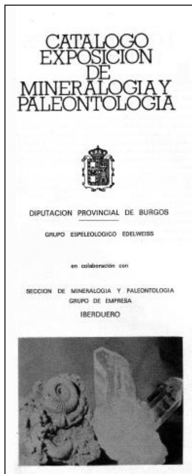
Portada del catálogo de la Exposición de Mineralogía y Paleontología