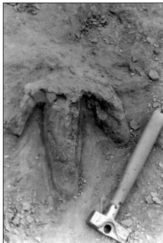
Una de las primeras fotos de las huellas tridáctilas.